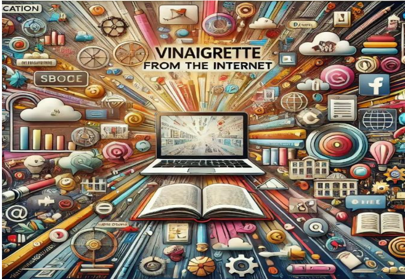
Рис. 2. Колаж «Цінність нашого життя» (Альона Б.)

З метою ілюстрації можливостей застосування техніки «Колаж» у роботі зі здобувачами закладів вищої освіти наведемо приклади робіт, виконаних студентами у межах навчальної дисципліни «Кризова психологія». Зокрема, подано два індивідуальні колажі на тему «Цінність нашого життя» (рис.2), що відображають бачення пріоритетів, смислів і ресурсів студентської молоді, а також колаж на тему «Мій настрій» (рис.3), який відображає індивідуальні емоційні переживання студента, його суб'єктивне ставлення до подій повсякденного життя та символічні образи, які асоціюються з настроєвим станом у момент виконання роботи.